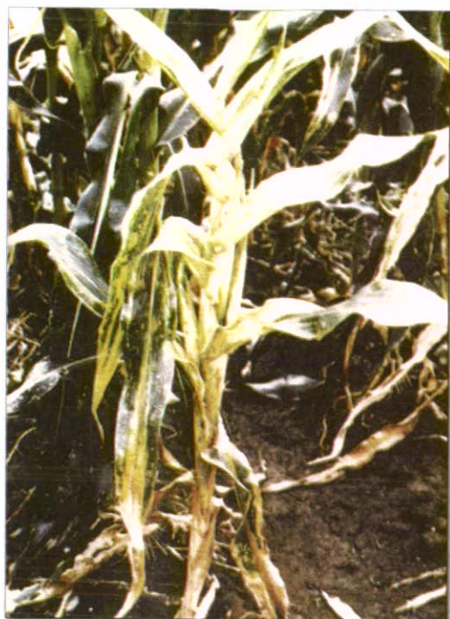
نشانه‌های بیماری بر روی بوته