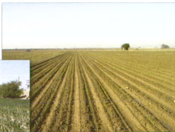
کشت دو ردیفه ذرت