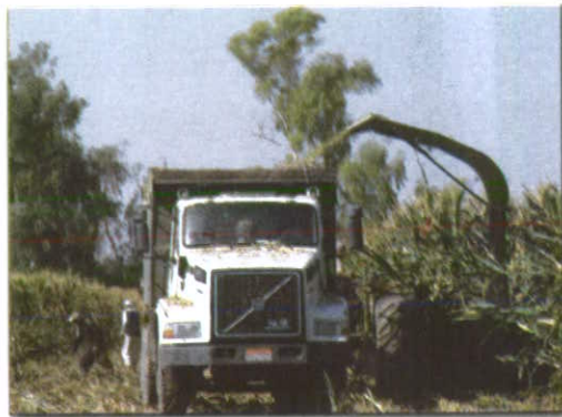
برداشت علوفه ای ذرت