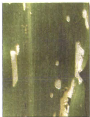
خسارت کرم برگخوار

دشمنان طبیعی : زنبور پارازیت از خانواده براکونیده به نام هابروبراکون و مگس های خانواده تاچی نیده، پارازیتوئید مرحله لاروی میزبان هستند.