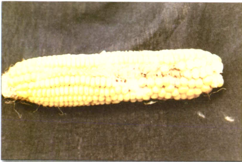
علائم بیماری پوسیدگی دانه