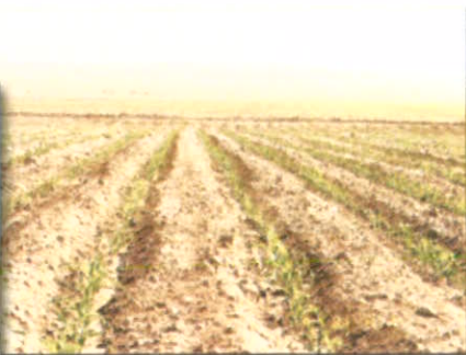
کشت داخل جوی