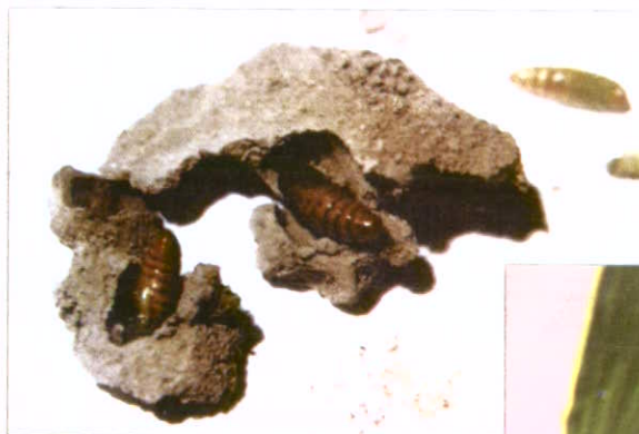
شفیره کارادرینا در میان خجره گلی

ب) دشمنان طبیعی : از خانواده زنبورها و مگس ها انواع پارازیت لارو برگ خوار وجود دارند که جمعیت این آفات را می توانند کنترل کنند. لازم به ذکر است که در شرایط خوزستان در زراعت ذرت بر علیه این آفت هیچ گونه مبارزه شیمیایی توصیه نمی شود.