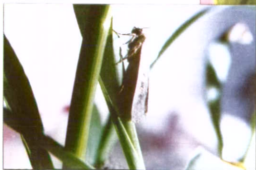
شب پره بالغ کارادرینا در حالت استراحت روی گیاه ذرت