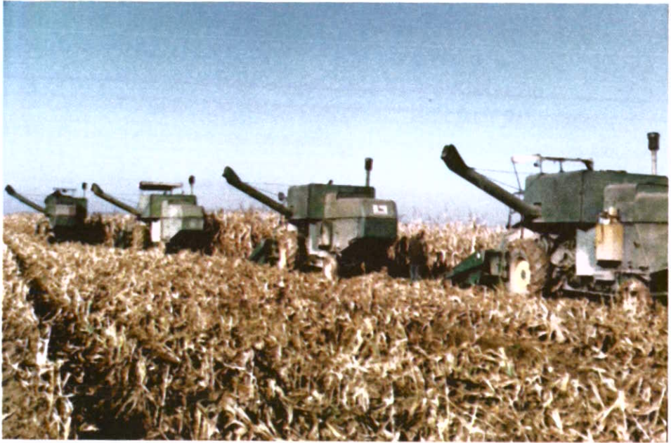
برداشت ذرت خشک