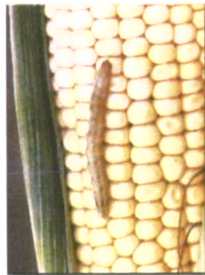
لارو کرم برگ خوار