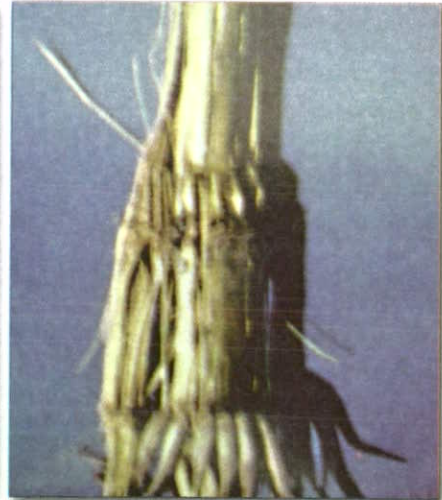
علائم بیماری باکتریایی پوسیدگی نرم ساقه