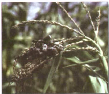
خسارت روی خوشه

سیاهک معمولی ذرت از بیماری های مهم این محصول در دنیا می باشد. این بیماری قارچی قبلا در خوزستان وجود نداشته، ولی متاسفانه اولین آلودگی بوته های ذرت در اواخر خرداد ماه ۱۳۸۴ در چند مزرعه کشت ذرت بهاره در منطقه لور اندیشک مشاهده شد. گرمای تابستان خوزستان نمی تواند موجب توقف رشد و از بین رفتن آن شود به همین دلیل آلودگی سیاهک معمولی به مزارع کشت پاییزه استان هم سرایت کرده است. بیماری تقریبا در تمام مناطق کشت ذرت خوزستان وجود دارد. کنترل این بیماری بسیار مشکل است و ضد عفونی بذر هم تاثیری در کنترل بیماری ندارد. به همین دلیل باید از روش های زراعی، مکانیکی و تناوب زراعی و نیز استفاده از ارقام و لاین های مقاوم جهت کنترل آن استفاده شود.