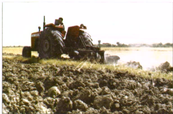
شخم زدن زمین توسط گاو آهن ۳ خیش

شخم باید با دقت و به عمق ۳۰-۲۵ سانتی متر و در زمان گاو رو بودن زمین انجام شود. استفاده از گاو آهن مناسب و تراکتوری با قدرت کشندگی مطلوب برای تهیه ی بستر کاشت ضروری است.