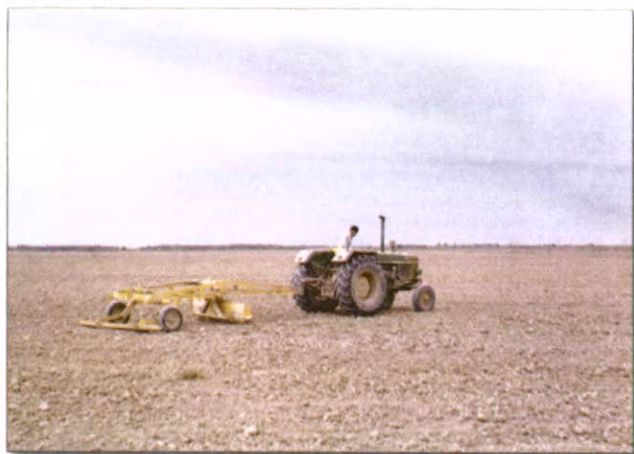
ماله زدن زمین

برای صاف کردن شیارهایی که موقع شخم و دیسک زدن ایجاد می شود، حتماً باید ماله زد تا بستر صاف و یکنواختی تهیه گردد.